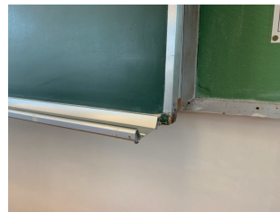
パーツがなくなっている

※黒板面の色彩、光沢度、表面の粗さ等は、日本産業規格(JIS)で規定されています。 また、「学校環境衛生の基準」で毎年1回検査を行うことが規定されています。