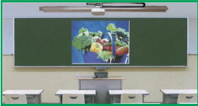
スクリーン兼用黒板ホーロー「クリアグリーン」