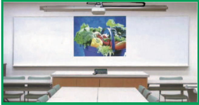
スクリーン兼用白板ホーロー「クリアホワイト」