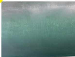
キズが入っている 暗線が赤くなっている