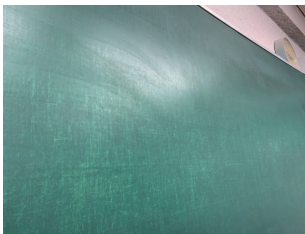
黒板が摩耗して光っている